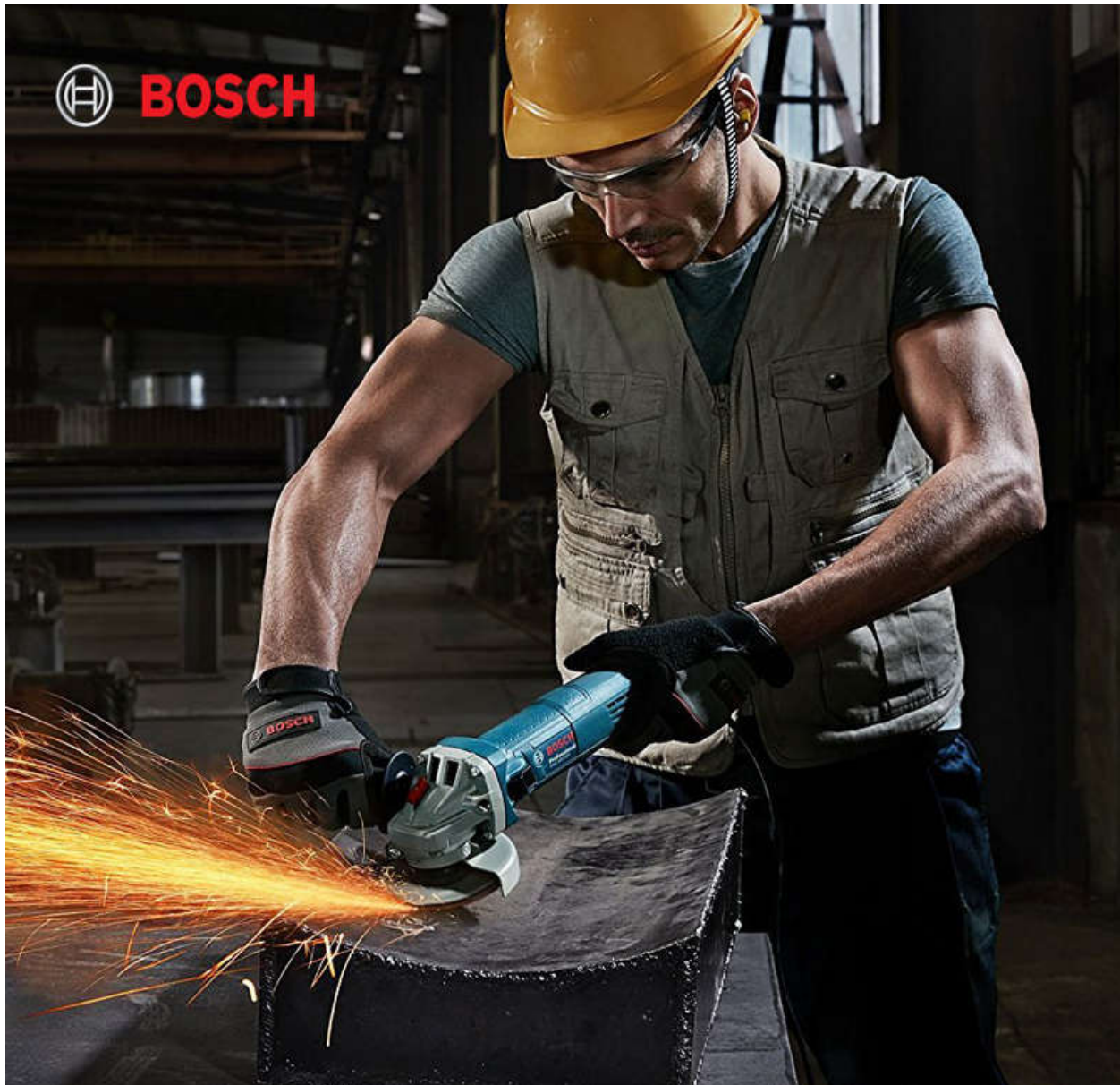
Bosch GWS 900-100 S chất lượng cho tính ứng dụng thực tế cao

Tính an toàn trong lao động là điều mà bất cứ thiết bị cầm tay Bosch nào cũng đều hướng tới, máy mài GWS 900-100 S cũng hết sức chú trọng vấn đề này khi ngay từ các vật liệu cấu thành cho tới các tính năng bảo vệ chuyên biệt, do đó cung cấp sự an tâm trong suốt quá trình làm việc. Bảo vệ người dùng bắt đầu bằng công tắc an toàn Bosch, đảm bảo rằng máy mài góc GWS 900-100 S có thể được bật một cách có kiểm soát, nếu công cụ bị rơi, công tắc này sẽ được giải phóng và động cơ dừng. Tính năng chống khởi động lại khi gặp tình trạng mất điện hoặc hoạt động tại nơi có điện lưới chập chờn giúp tránh khỏi các sự cố khi máy bất ngờ hoạt động lại.